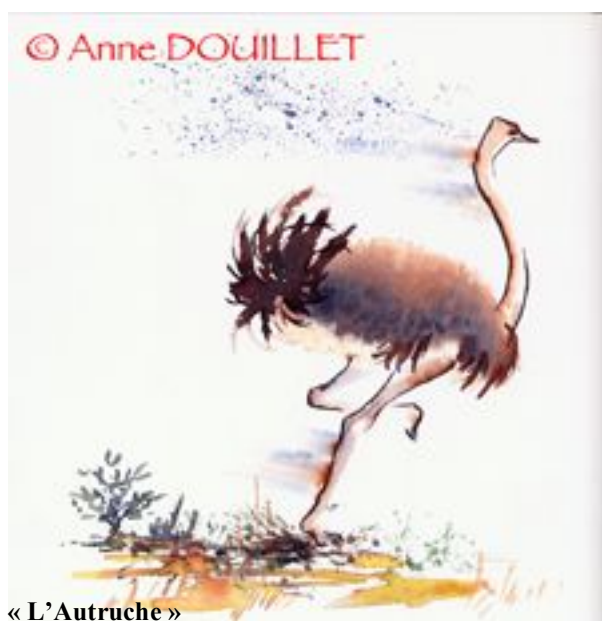
« L'Autruche »